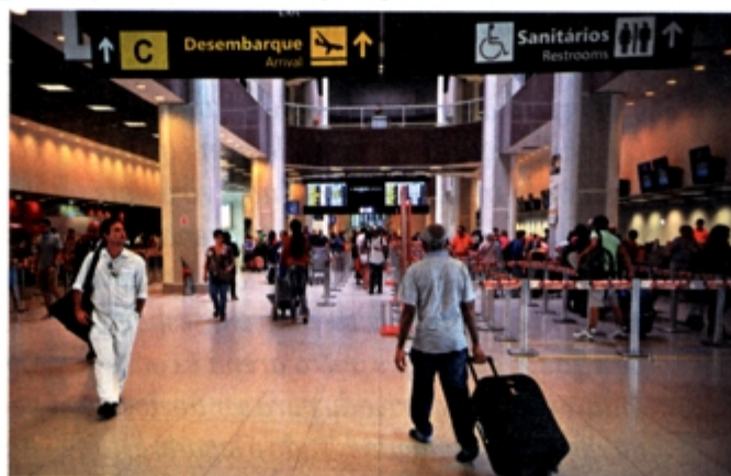
O aeroporto Santos Dumont, no Rio de Janeiro, pode ser entregue à iniciativa privada

“Por que o Estado precisa ficar administrando aeroporto? Não é papel dele”