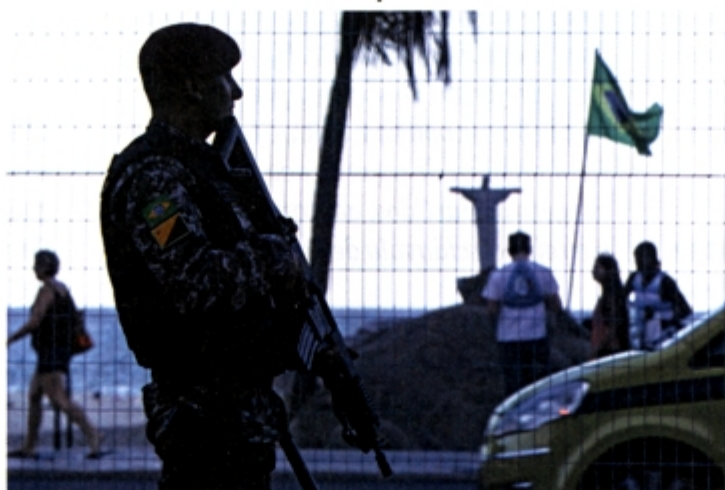
Com o apoio das Forças Armadas, a segurança foi reforçada em Copacabana, no Rio de Janeiro

gente perseguiu o tempo todo. Outro dia eu fui interpretado de maneira equivocada quando disse que o Brasil perdia uma oportunidade com a Olimpíada. Era um pouco isso. A Olimpíada não pode ser apenas a celebração. A festa é incrível, mas é também uma oportunidade de mostrar que o País consegue fazer as coisas no custo e no prazo. Foi o que fizemos com a Olimpíada do Rio. Não tem Olimpíada com tanto dinheiro privado como a do Rio. Do custo das Olimpíadas, incluindo estádio e vila olímpica, 60% é privado. O estádio olímpico de Londres custou mais dinheiro público do que todos os estádios que estamos fazendo. É um super case para termos orgulho, mas o nosso complexo de vira-lata está exacerbado.